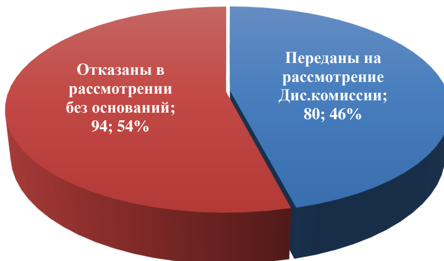
Рисунок 1 – Поступившие обращения в 2024 году

Как показано в рисунке 1, 94 обращения возвращено заявителям с соответствующими обоснованиями, среди которых: обращение оппонентов по судопроизводству; отсутствие в действиях юридического консультанта дисциплинарного проступка; в связи с необоснованностью и отсутствием доказательств, что составляет 54% от общего числа поступивших обращений от физических и юридических лиц.